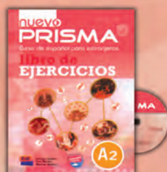
Libro de ejercicios + CD de audio – Con actividades de repaso específicas para la preparación del examen DELE.